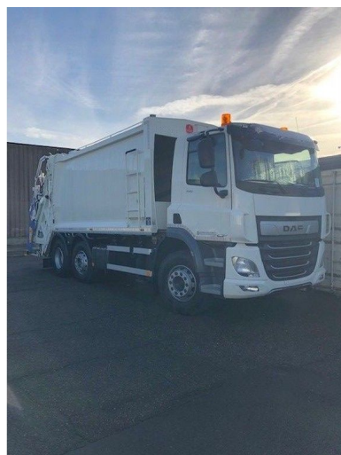
DAF CF 340 FAG MOL VDK Pu... 6x2