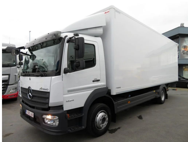
Mercedes-Benz RENTING MERCEDES ATEGO 1224 , ... 4x2