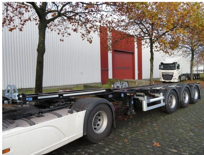
LAG UNIVERSAL SUPER SLIDER 0-3-CC , different location ...