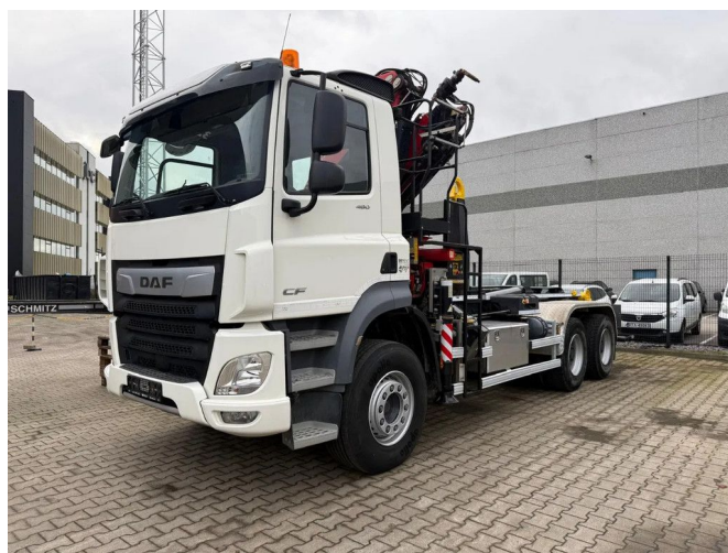
DAF CF 480 FAT + Crane FASSI F235A.2.23 E-DYNAM... 6x4