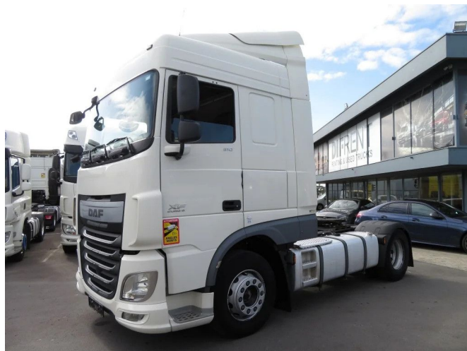
DAF XF 510 FT SPACE CAB