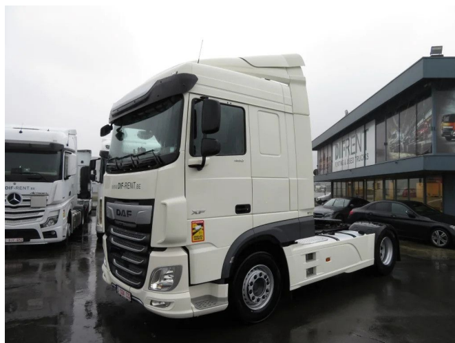
DAF XF 480 FT SPACE CAB