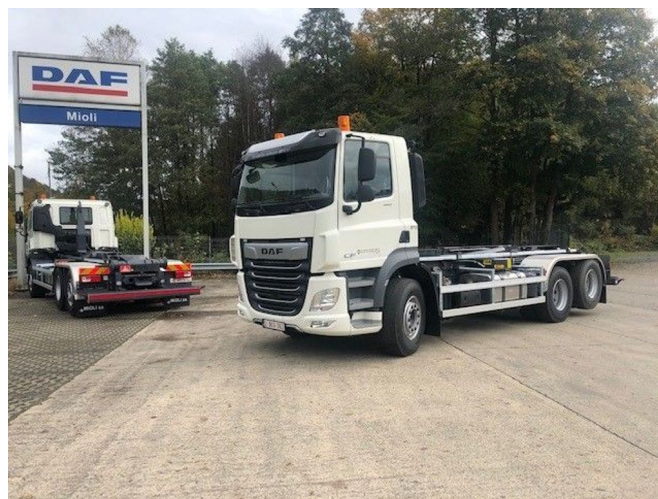
DAF CF 480 FAS Containerhook LC TAM T22