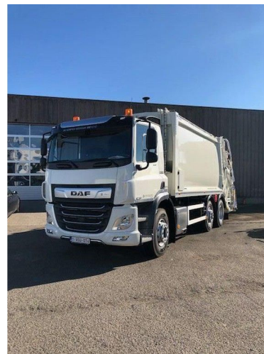
DAF CF 340 CF 340 FAG MOL ... 6x2