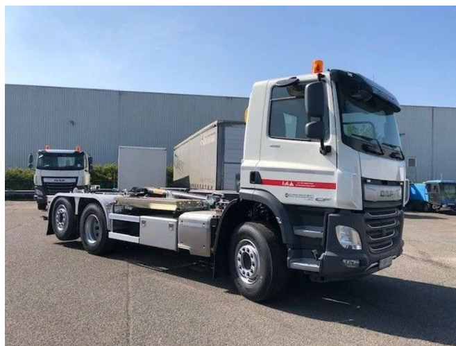
DAF CF 450 450 FAN 6X2 axle with HYVA Loader 20-53-S

Referentienummer: CHW10 - 2BSF128 - 0G372217